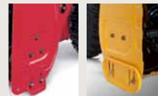
Estándar 90 x 15 mm (Largo x ancho)